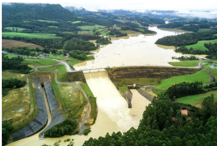
Barragem de Contenção de Enchente de Ituporanga

Será realizada a visita da Barragem de Contenção de Enchente de Ituporanga e a Coordenadoria Regional de Rio do Sul da Secretaria de Estado da Defesa Civil.