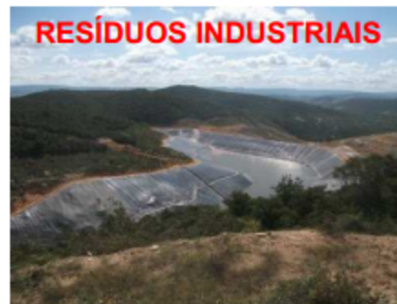
Órgão ambiental que licenciou o empreendimento