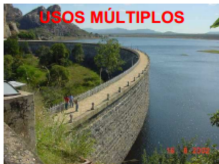
ANA ou órgãos estaduais de RH